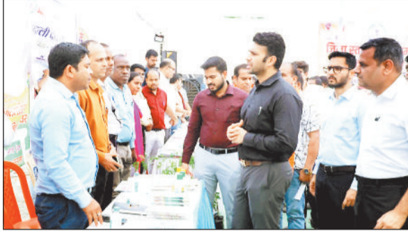
विभिन्न योजनाओं से हितग्राही हुए लाभान्वित

आमजननों की समस्याओं का त्वरित एवं प्रभावी निराकरण सुनिश्चित करने जिला प्रशासन द्वारा तहसील मुख्यालय पुसौर में जिला स्तरीय जनसमस्या निवारण शिविर का आयोजन किया गया। शिविर में बड़ी संख्या में ग्रामीणों की उपस्थिति रही, जिन्होंने अपनी विभिन्न समस्याओं से संबंधित आवेदन प्रस्तुत किए, जिनमें से कई का मौके पर ही समाधान किया गया। शिविर स्थल पर सुव्यवस्थित पंजीयन काउंटर, हेल्प डेस्क, विभिन्न विभागों के स्टॉल, पेयजल एवं छाया जैसी मूलभूत सुविधाएं सुनिश्चित की गई थीं। साथ ही आईटीआई परिसर में टीवी जांच हेतु हैंडहेल्ड एक्सरे, आधार पंजीयन, लर्निंग लाइसेंस तथा ई.श्रम कार्ड बनाने की विशेष